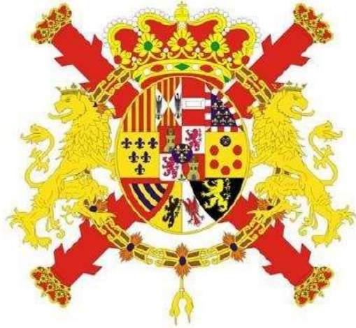
Bandera de compañía de las Reales Guardias Españolas