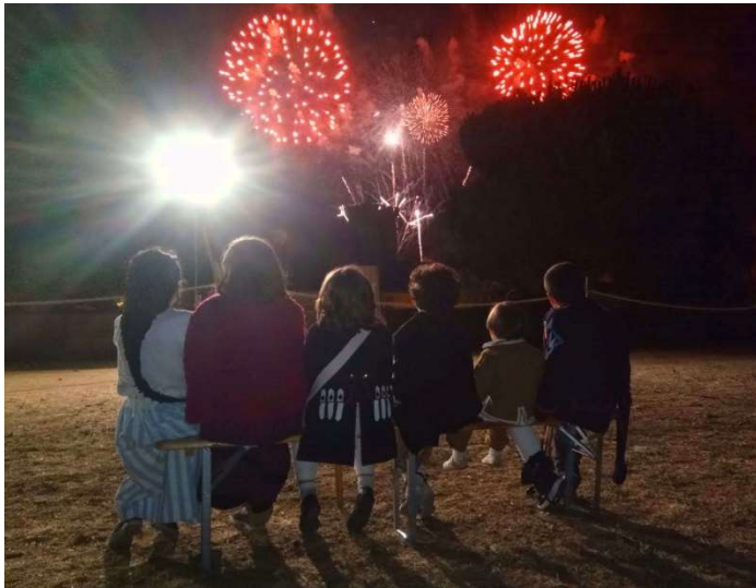
Jóvenes recreadores en el final de la batalla de Almeida (Portugal, 2022)