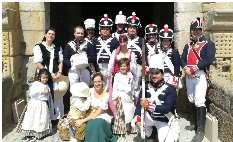
Compañeros y amigos en Almeida

Pese a tan serio cometido, somos, ante todo, un grupo de amigos, pues es esa camaradería la que nos hace disfrutar realmente de esta afición.