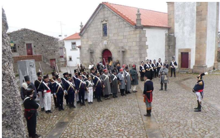
Expedición de la AERH al bicentenario de Waterloo (Bélgica, 2015)