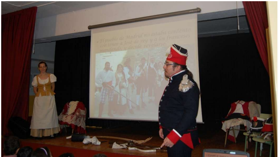
Jornadas culturales del Dos de Mayo CEIP Nuestra Señora de la Concepción (Madrid, 2015)