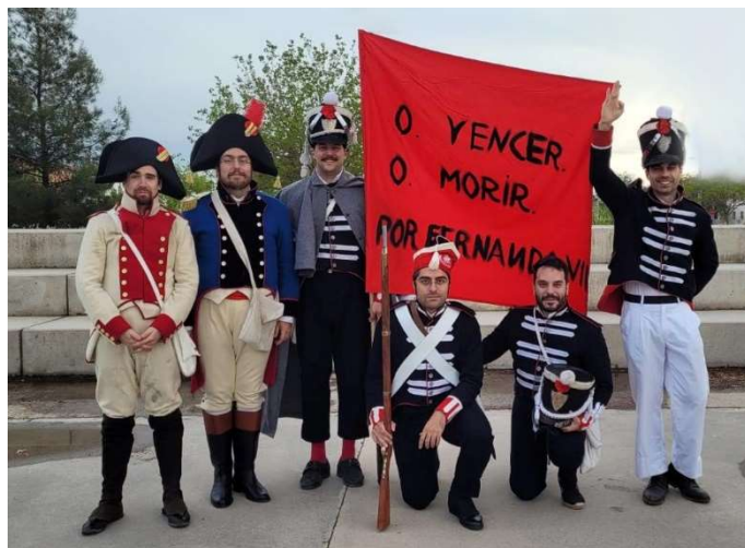
Evento de divulgación del Dos de Mayo (Madrid, 2022)