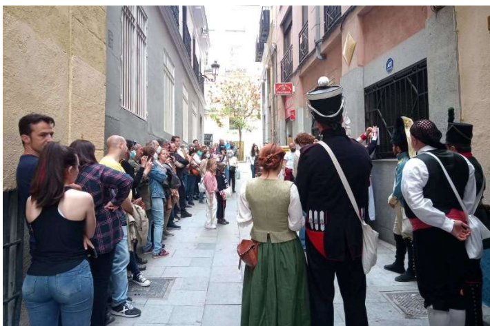
Ruta del Dos de Mayo (Madrid, 2022)