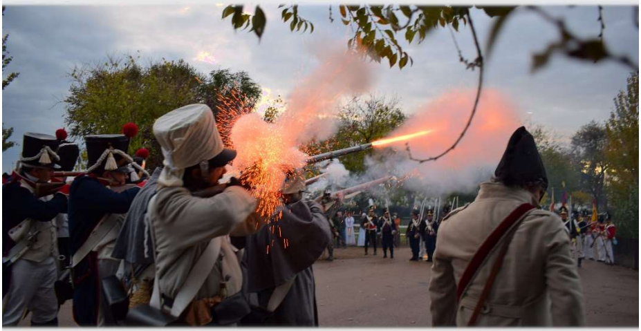
Combate durante la recreación de La Albuera (Badajoz) 2021

Existen varios formatos de Recreación Histórica. La más grandiosa es la recreación de batallas , donde los combates, los uniformes, los cañones y los animales (o vehículos, en otras épocas), ofrecen al público no sólo una idea de cómo fue el pasado que vivieron sus antepasados, sino también un espectáculo incomparable.