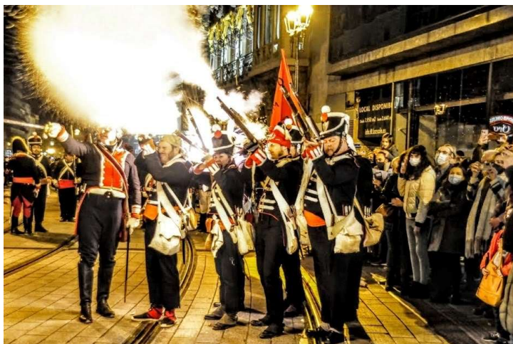
Reales Guardias Españolas en los Sitios de Zaragoza (Zaragoza, 2022)