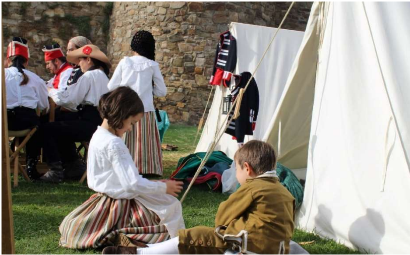
Campamento en Astorga (León, 2018)