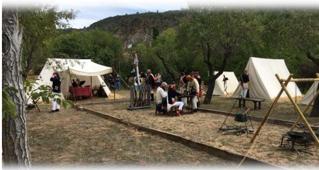
Campamento de la recreación de Tramacastiel (Teruel)

La recreación histórica, o historia viva, es una vivencia que reproduce fielmente la forma de vida de unas personas de un marco histórico concreto, a ser posible en el mismo lugar en el que se produjo.